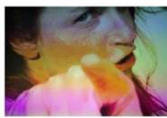
Schauspielhaus Zürich 22.22.04 Theaterfestival vom 7. bis 10. November 2023