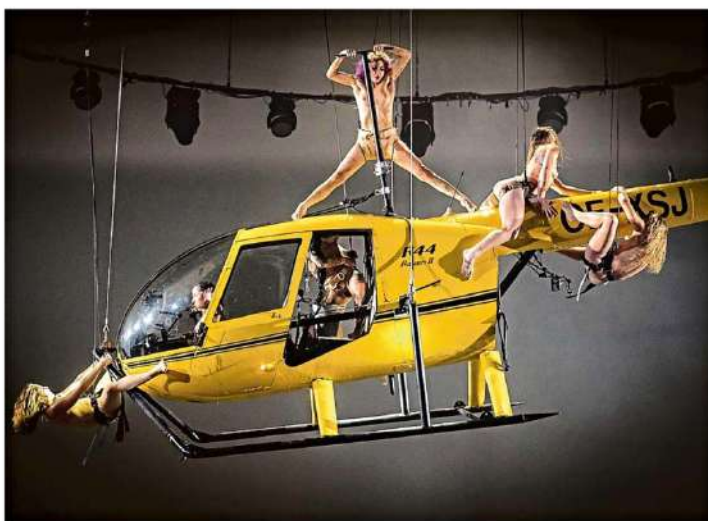
Orgastické třetění na helikoptéře ve vídeňském Volksbühne