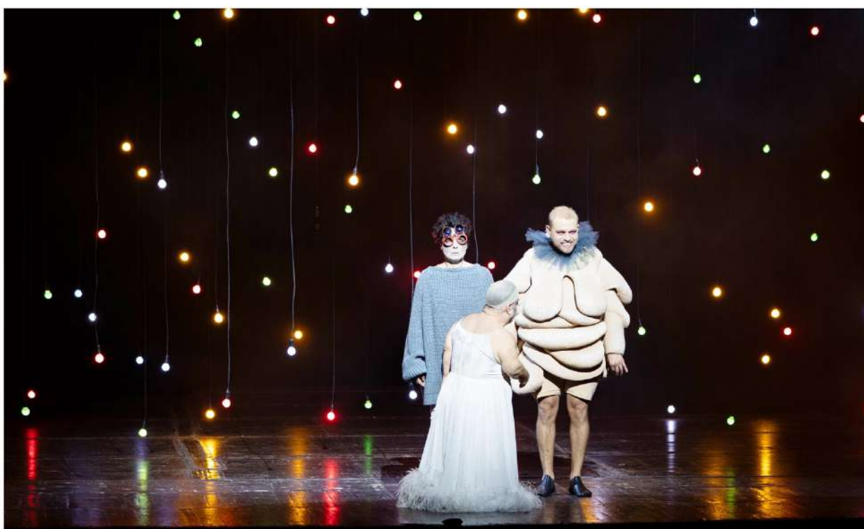
Berliner Ensemble Wolfgang Borchert: Draussen vor der Tür / Venku přede dveřmi Režie / Regie: Michael Thalheimer