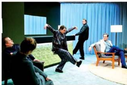
1) Das Theaterstück „Doughnuts“ thematisiert auf bizzare Weise den Verlust von traditionellen Gewissheiten.

Das Prager Theaterfestival deutscher Sprache ist seit 28 Jahren ein absolutes Highlight für Theaterliebhaber in Tschechien. Das diesjährige Festival steht unter dem Motto „Selbst schuld“.