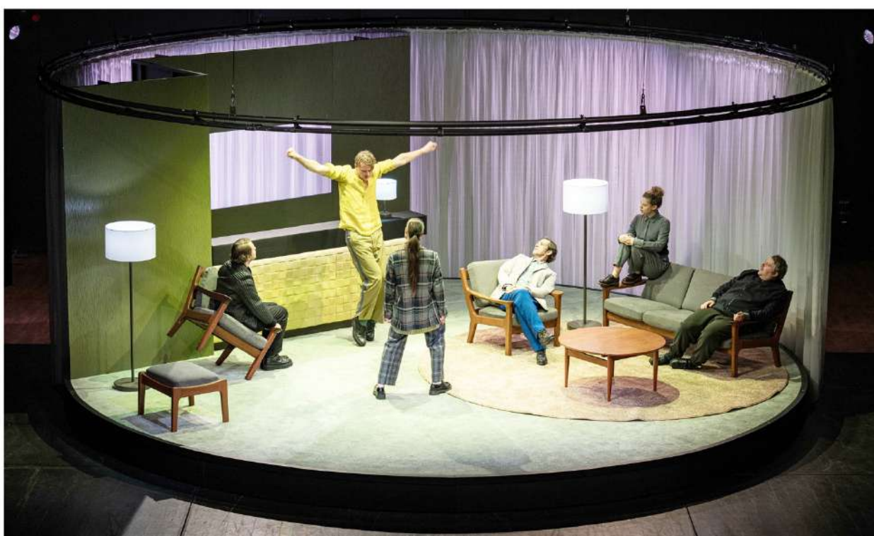
Thalia Theater Hamburg Toshiki Okada: Doughnuts Režie / Regie: Toshiki Okada