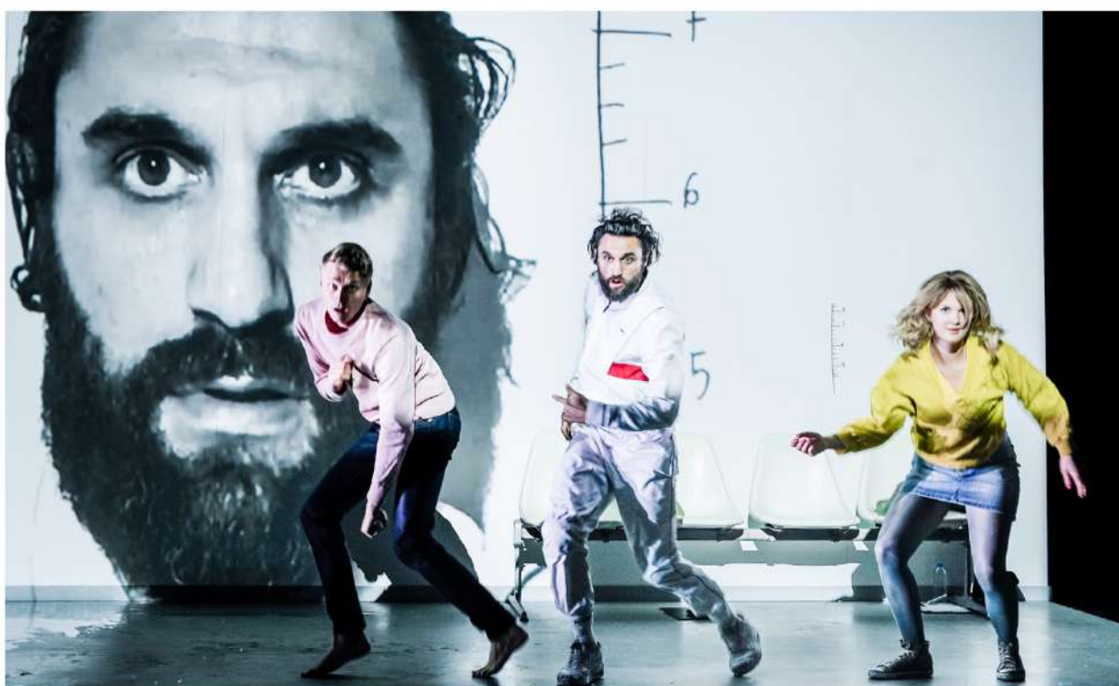
Schaubühne am Lehniner Platz, Berlin Édouard Louis: Im Herzen der Gewalt / Dějiny násilí Režie / Regie: Thomas Ostermeier