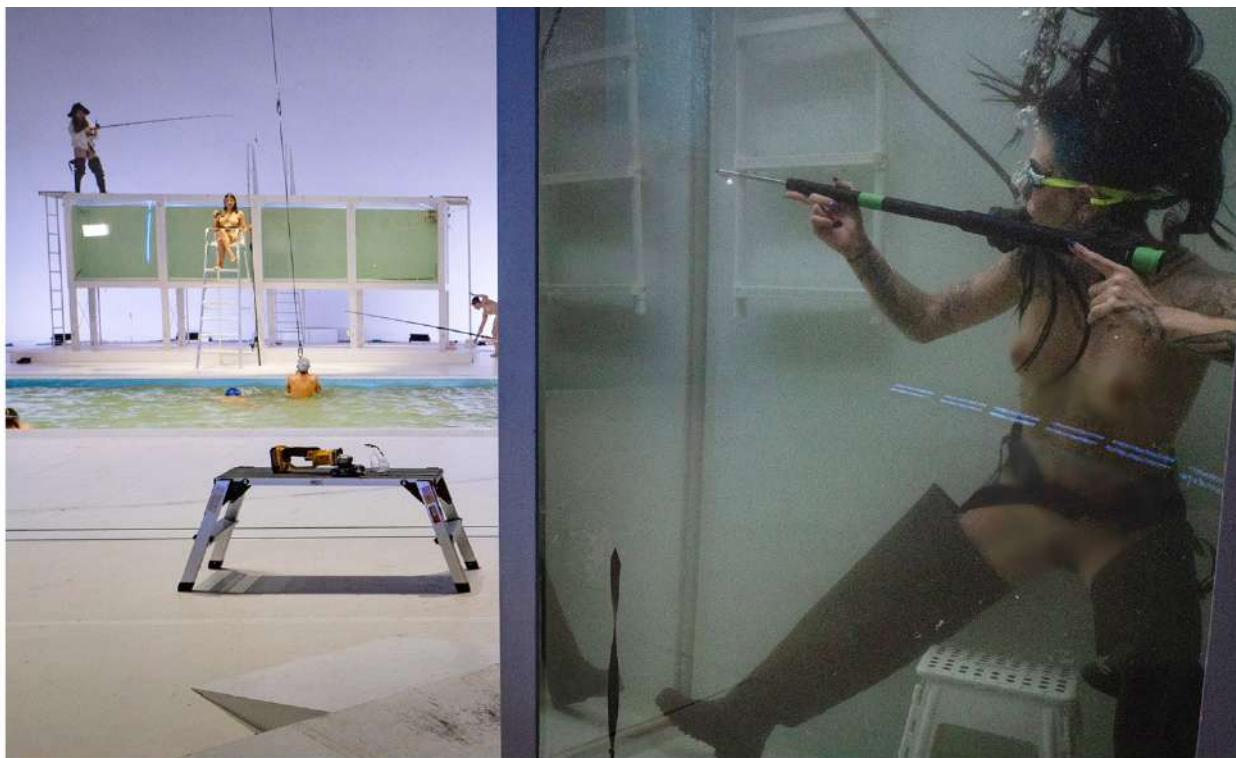
Volksbühne am Rosa-Luxemburg-Platz, Berlin Florentina Holzinger: Ophelia's Got Talent Režie / Regie: Florentina Holzinger