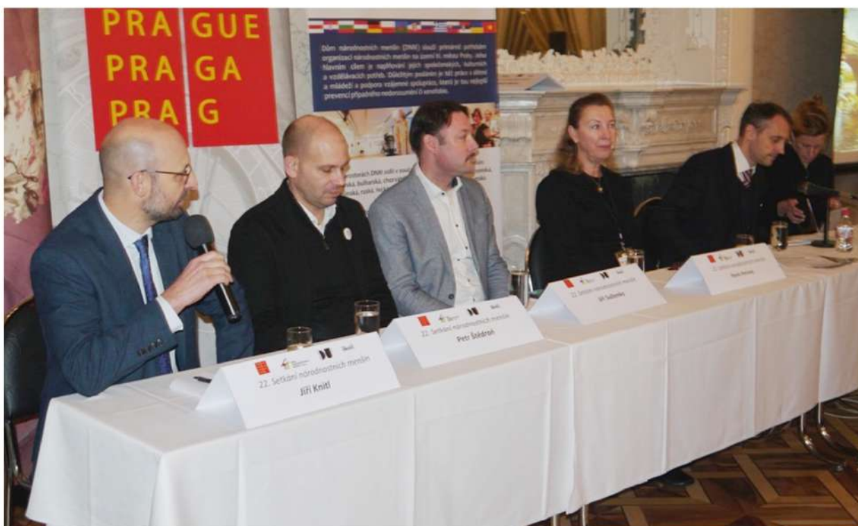
Dům národnostních menšin, Hlavní město Praha, Divadlo Na zábradlí, IDU Národnostní menšiny a divadlo / Nationale Minderheiten und Theater Konference / Konferenz Off-program / Off-Programm