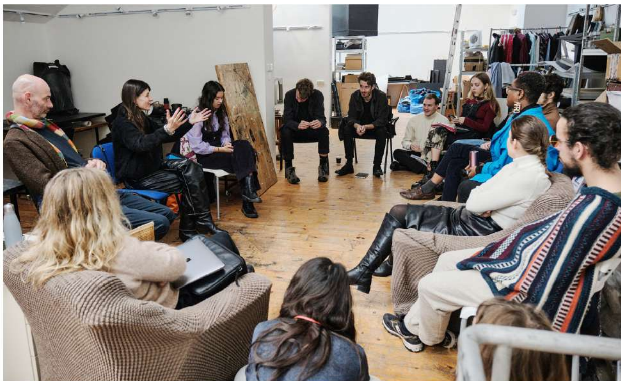
Goethe-Institut, theater.cz, DAMU Nina Wetzel Workshop Off-program / Off-Programm