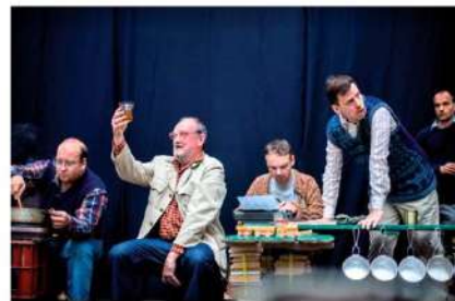
2) Ein Einblick in die tragische Komödie „Sex“, die vom Laientheater ZUMPA aufgeführt wird.