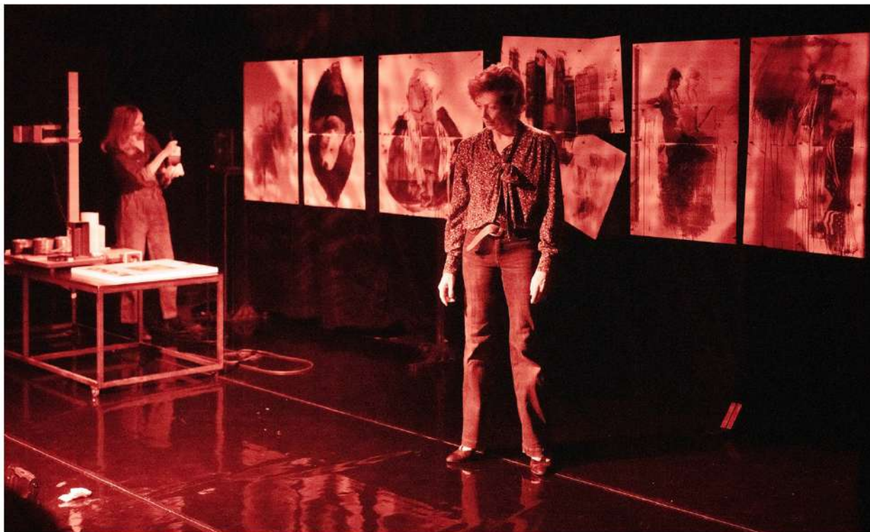
Volkstheater Wien Annie Ernaux: Die Scham / Stud Režie / Regie: Ed. Hauswirth